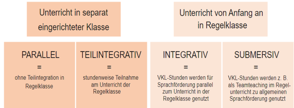
Abb.: Schulorganisatorische Modelle in Baden-Württemberg in Anlehnung an Decker-Ernst 2017