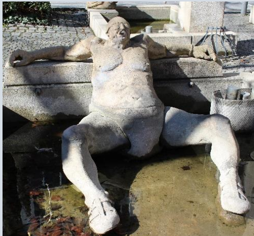
Konstanzer „art de vivre“

Die Stadt Konstanz ist eine der lebenswertesten Deutschlands. Direkt am See gelegen und die Alpen vor der Nase (mit dem Auto ca. 1 ½ Stunden ins nächste größere Skigebiet) sind die Freizeitmöglichkeiten schier unendlich. Wasser- und Bergsport, viele Inseln wie Mainau und Reichenau, sowie eine riesige Zahl beliebter Touristen-Hotspots bieten vielfältige Lernablenkungen. Natürlich kommt es auf den persönlichen Geschmack an, mit ihren ca. 85.000 Einwohnern ist die Stadt nichts für Liebhaber von Millionenmetropolen. Man muss es kleiner und persönlicher mögen. Weitere Kehrseite der hervorragenden Lebensqualität sind die im Vergleich zu manch anderen