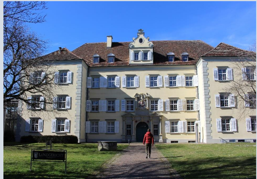
Das Landgericht – Hauptgebäude

Trotz vieler Vorzüge, die unsere Stammdienststelle zu bieten hat, soll die vorliegende Übersicht nicht vorrangig Zwecke des Marketings verfolgen. Zwar präsentiert sich Konstanz, die Perle am Bodensee, klein aber fein, mit internationalem Flair direkt an der Schweizer Grenze und vor wunderschöner Alpenkulisse auf zwei Halbinseln im drittgrößten Binnengewässer Europas gelegen, als mondäner Lifestyle-Hotspot für Kenner und Genuss-Menschen. Die folgenden Eindrücke und Informationen sollen Euch dennoch helfen, auch unter Berücksichtigung persönlicher Vorlieben genau den Ausbildungsstandort für das Referendariat zu wählen, der vollkommen zu Euch passt und Euren individuellen Vorlieben bestmöglich gerecht wird.