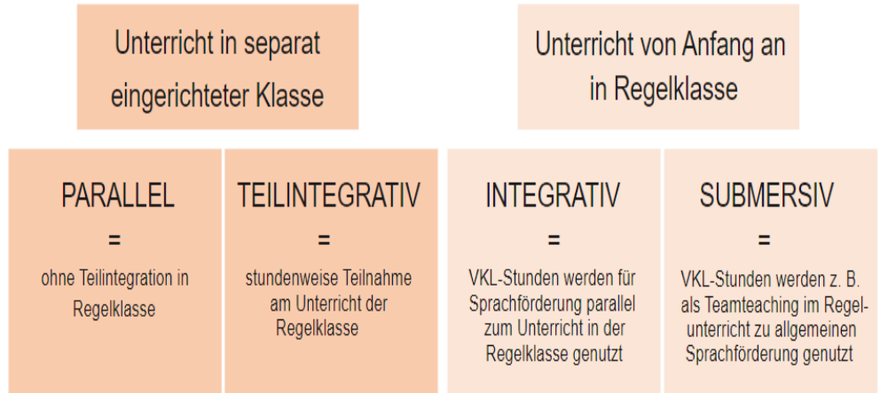
Abb.: Schulorganisatorische Modelle in Baden-Württemberg in Anlehnung an Decker-Ernst 2017