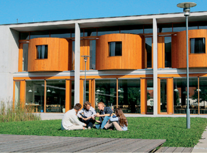
DAS LANDESGYMNASIUM FÜR HOCHBEGABTE AUF EINEN BLICK