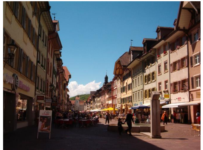
Fußgängerzone in Waldshut

Wer dem Landgericht Waldshut-Tiengen zum Referendariat zugeteilt wird, kann sich auf zwei arbeitsreiche, aber schöne Jahre freuen. Viele Referendare aus allen Teilen Deutschlands, die die zwei Jahre bis zum zweiten Staatsexamen hier verbracht haben, blicken positiv auf ihr Referendariat zurück.