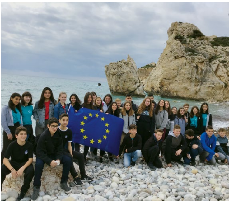
Unterwegs in Europa mit Erasmus+